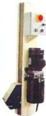
Bomba Hidráulica Italiana