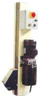
Bomba Hidráulica Italiana