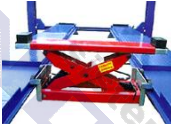
Carro de elevación central